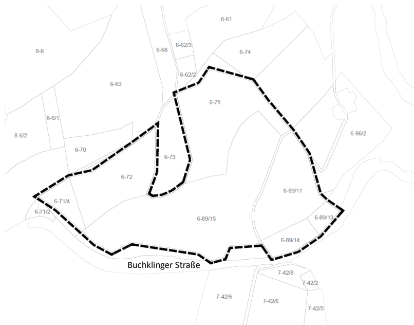
Abbildung 2: Umgriff des Plangebiets – Eigene Darstellung auf Grundlage von Geoportal BW, o.M.

Ziel der Planung ist die Festsetzung eines Sondergebietes für eine erdgebundene Freiflächen-Photovoltaikanlage innerhalb eines nach dem Erneuerbaren-Energien-Gesetzes „landwirtschaftlich benachteiligten Gebietes“, um dem Bedarf an klimafreundlichen erneuerbaren Energien sicherzustellen. Im Rahmen der Bauleitplanverfahren wird eine Umweltprüfung gem. § 2 Abs. 4 BauGB durchgeführt.